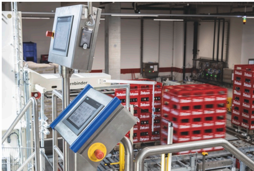
Ins Produktionsnetzwerk eingebundene SIMATIC HMI Panels machen die Prozesse lokal transparent und komfortabel bedienbar.