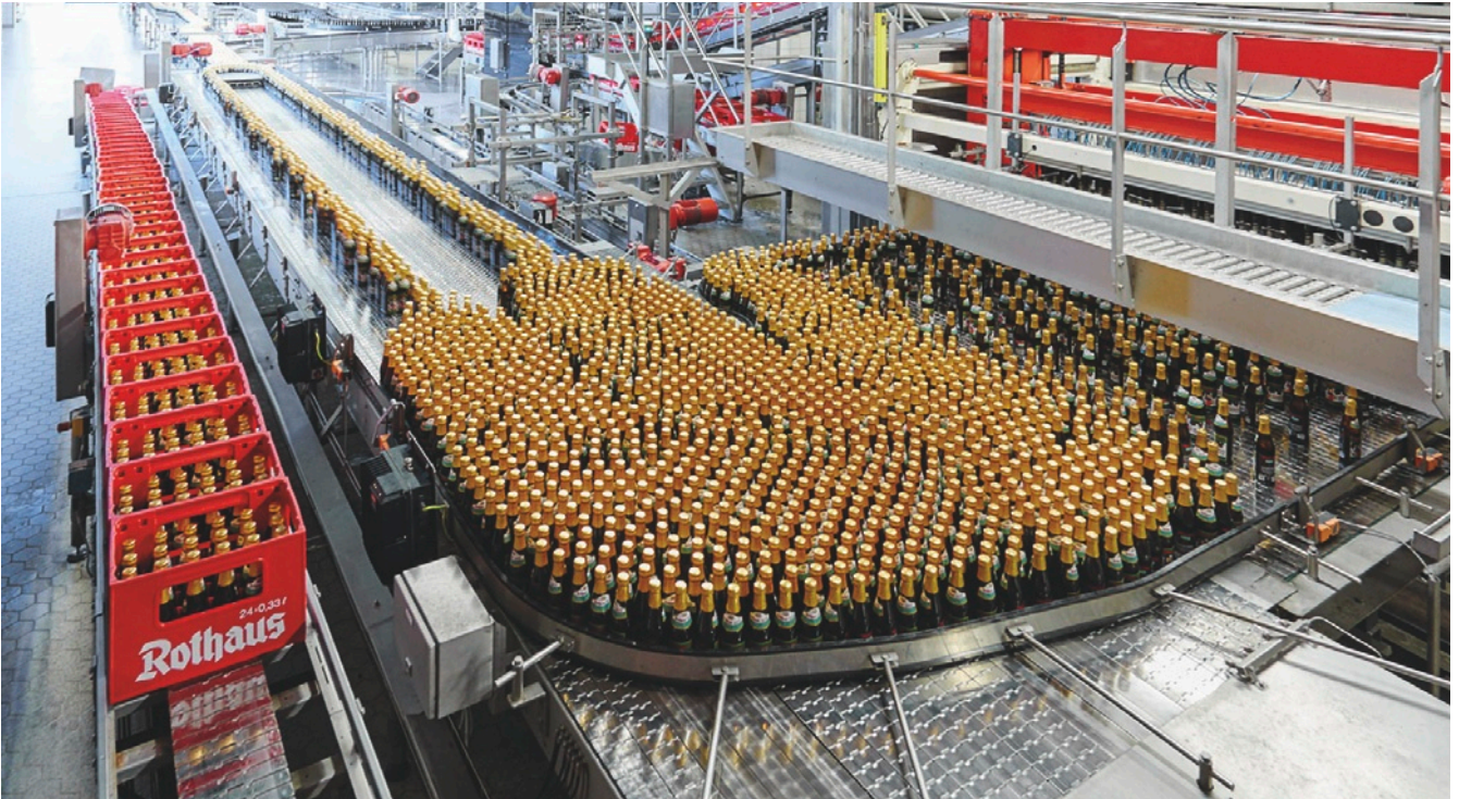
Wasser, Hopfen, Malz und ein performantes Netzwerk sind bei Rothaus elementare „Zutaten“ für effiziente Herstellung guter Biere.

Angesichts stetig steigender Datenmengen und wachsenden Kommunikationsbedarfs kam die bisher begrenzte Datenrate von maximal 100 Mbit/s hinzu. Daher sollte das Netzwerk von Grund auf modernisiert und mit den aktuell leistungsfähigsten Komponenten nach neuesten Maßstäben restrukturiert werden. Mit der Planung und Umsetzung betraut wurde die HWI IT GmbH, ein auf hoch verfügbare Netzwerkinfrastruktur-lösungen spezialisiertes Ingenieurbüro aus Malterdingen. Das Unternehmen arbeitet seit Jahren mit SCALANCE-Netzwerktechnik von Siemens, die von Haus aus auf das von Rothaus präferierte SIMATIC-Automatisierungsportfolio abgestimmt ist. Für die Kompetenz der Breisgauer Netzwerker spricht auch deren bevorstehende Zertifizierung zum Siemens Solution-Partner für industrielle Kommunikation. Mit Hilfe des langjährigen Lösungs-Know-hows der beteiligten Spezialisten von Siemens in Stuttgart konnten alle Beteiligten gemeinsam ein maßgeschneidertes Netzwerkkonzept für den Brauereibetrieb entwickeln und sukzessive umsetzen.